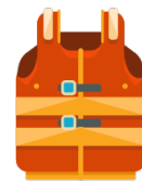
(el) chaleco salvavidas