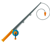
(la) caña de pescar