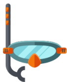
(las) gafas de buceo