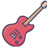
(la) guitarra eléctrica